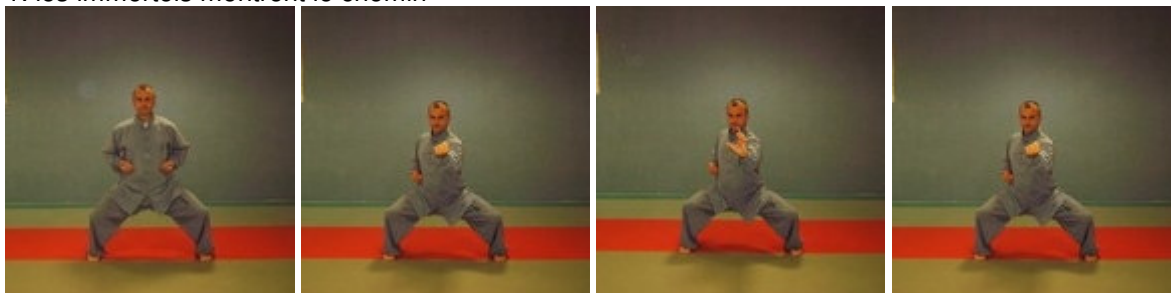
1: les immortels montrent le chemin (1)

(1) exécuter alternativement à droite et gauche